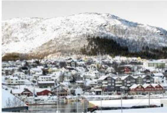
Aiemmin muun muassa norjalaiset kalatehtaat ovat houkutelleet suomalaisia työvoimaa. Kuva Årenan saarista, johon on mennyt työntekijöitä Oulun kaupungin työllisyyspalveluiden kautta.